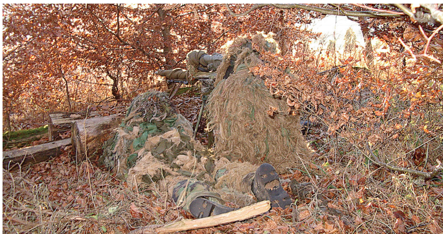
Η λεπτομερής παρατήρηση της περιοχής από την ΤΘΒ μέχρι τον στόχο είναι το πρώτο μέλημα των ΕΣ μετά την εγκατάστασή τους στην ΤΘΒ.

Ο ΕΣ, αφού εγκατασταθεί στην περιοχή του στόχου μαζί με τον παρατηρητή, η πρώτη ενέργεια τους μετά τη συμπλήρωση του καμουφλάζ, είναι η λεπτομερής παρατήρηση όλης της περιοχής μπροστά από τη θέση τους μέχρι τον στόχο. Εντοπίζουν όλους τους πιθανούς στόχους καθώς και τους πιθανούς κινδύνους για αποκάλυψη της θέσης τους.